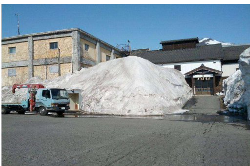
越後ゆきくら館 玉川酒造 (イメージ)