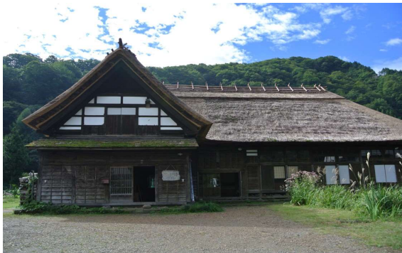
旧長谷部家住宅 叶津番所