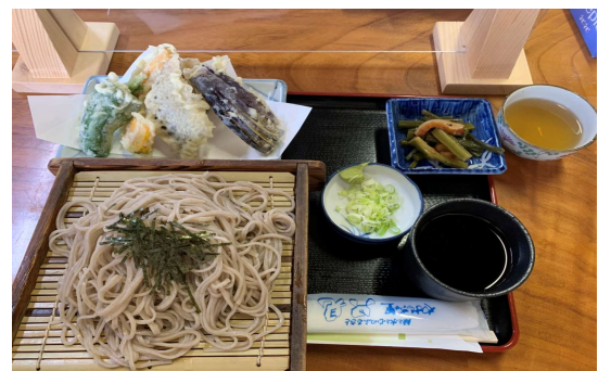
そば処 しおさわ庵 (イメージ)