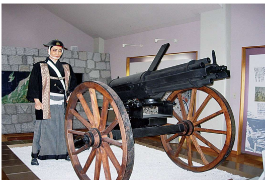
河井継之助記念館