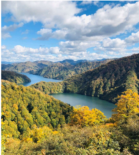
田子倉湖 (イメージ)